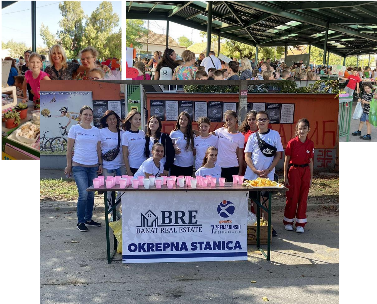
У недељу 1. октобра 2023. године чланови Ученичког парламента волонтирали су на седмом Зрењанинском полумаратону.