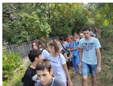
Почела је „Дечја недеља“