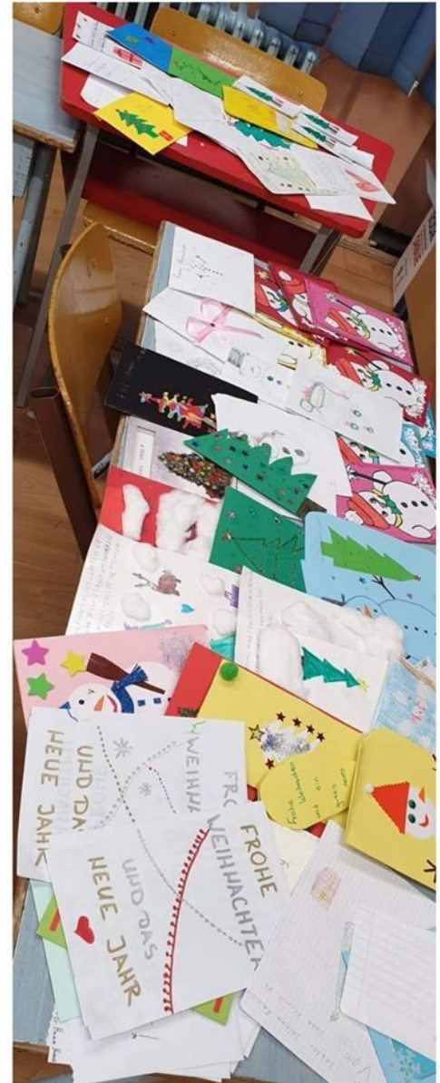
Čestitke na nemačkom jeziku su spremne! Najviše ih jš napravio V 3.