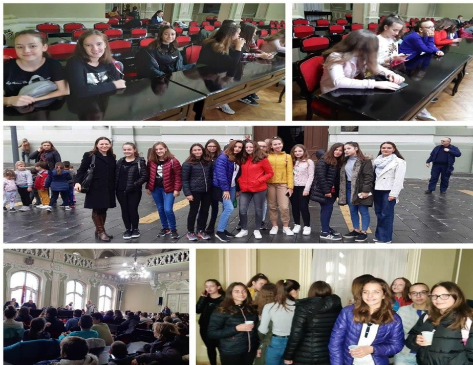
Đački parlament juče na prijemu kod gradonačelnika