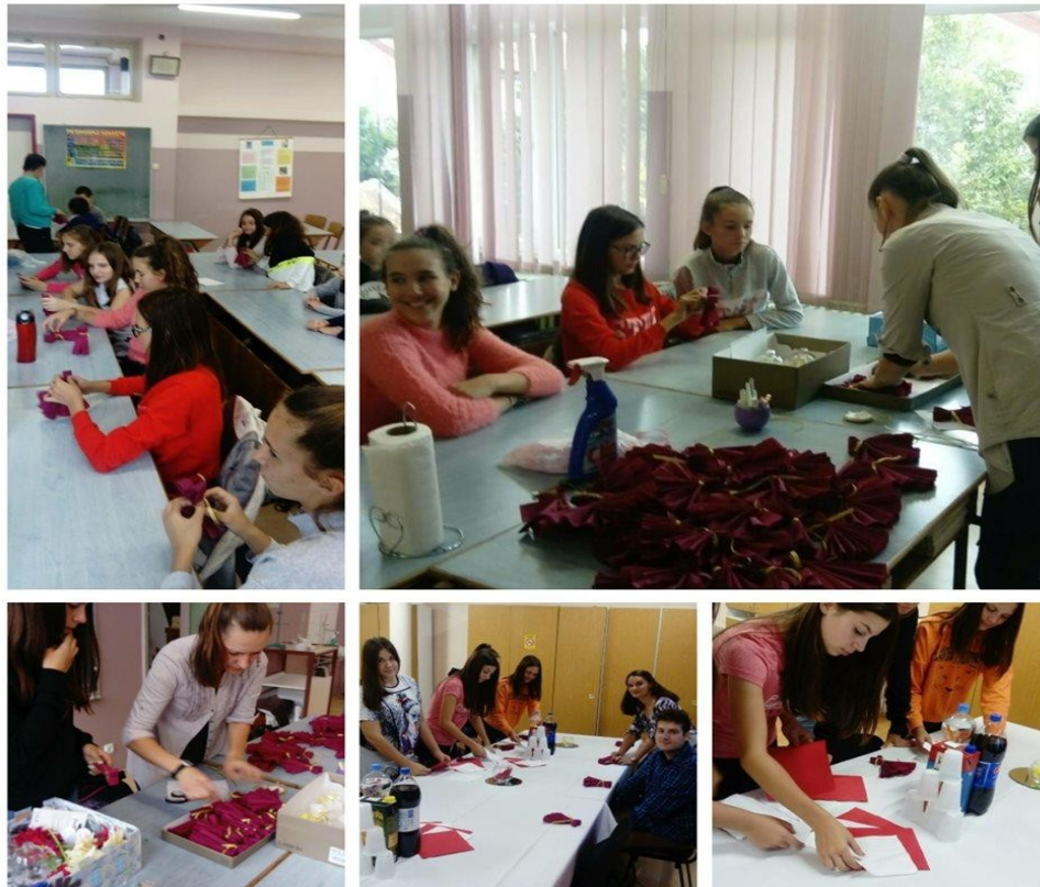
Vredne ruke Đačkog parlamenta